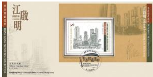
貼有一張郵票小型張並以特別郵戳蓋銷的首日封