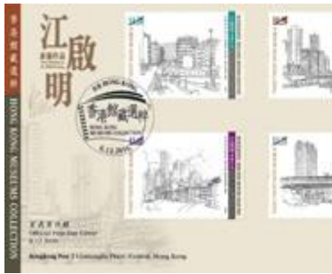
貼有一套六枚郵票並以特別郵戳蓋銷的首日封