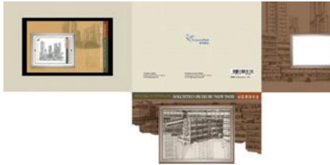
套摺 (內頁 1)