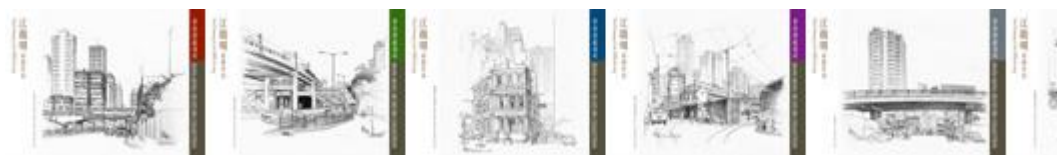
郵資已付圖片卡 (空郵郵資) (一套六款)